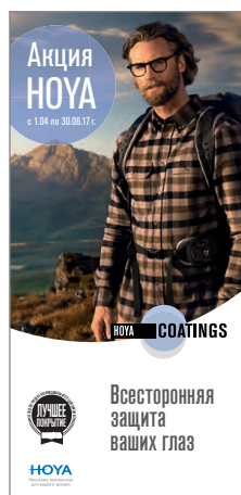
Лифлет для конечных потребителей (1/3 А4)