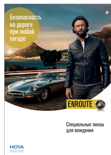
Брошюра для специалистов