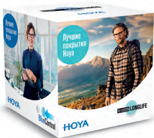
Куб для мест продажи (30 × 30 × 30 см)