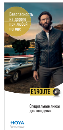
Лифлет для конечных потребителей (1/3 А4)