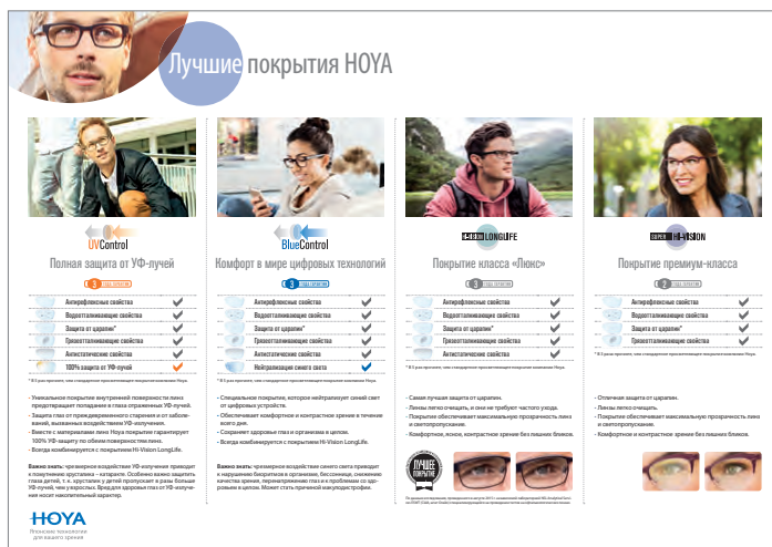
Настольный коврик А3