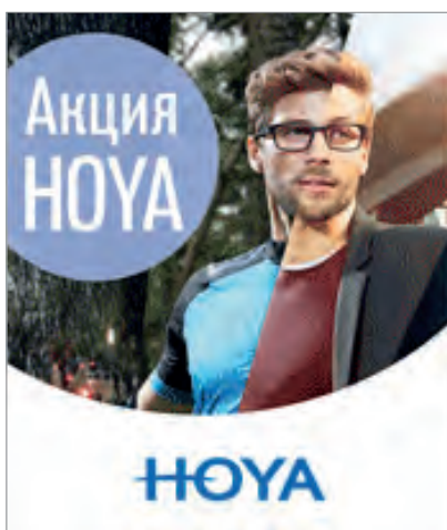
Баннер для сайта 175 × 210 px (gif анимированный)