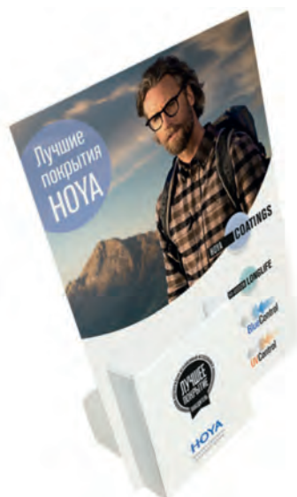
Диспенсер для лифлетов