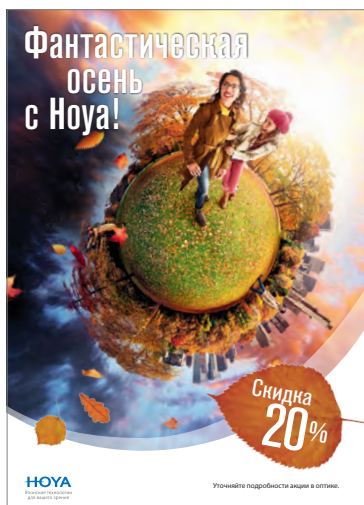
Информационный лист А4 двусторонний