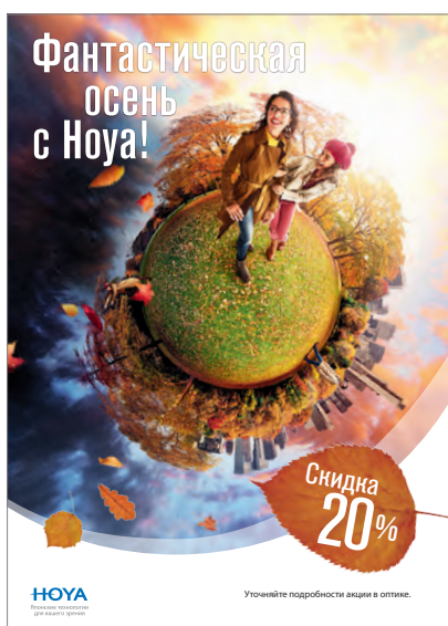
Плакат 495 × 695 мм двусторонний