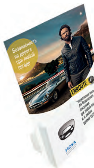
Диспенсер для лифлетов