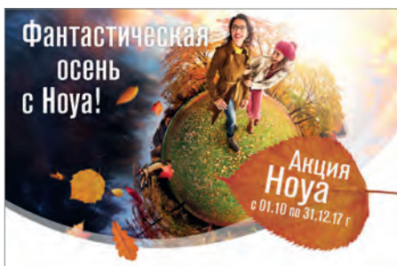
Баннеры для социальных сетей