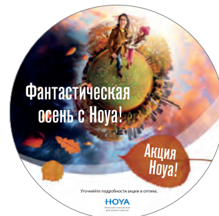
Наклейки для мест продажи (Ø195, 240, 330 мм)