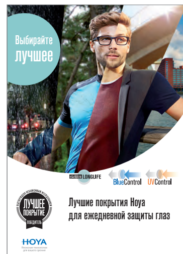
Брошюра для специалистов